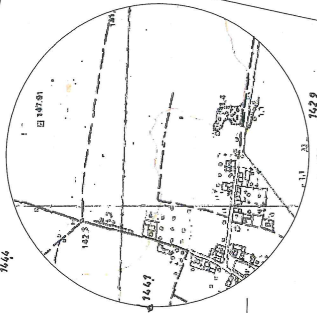
SZKIC ORIENTACYJNY 1:10000